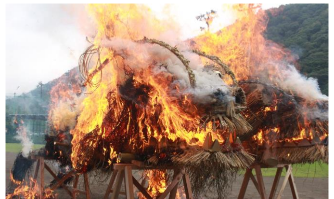
聖火への採火

らに、祭りへの参加を通して皆さんの仲間入りができると思つていましたので、地域の方と接する機会がなくなつたことが心残りです。来年こそは実施できるように思つていたところ、村のホームページでパラリンピック聖火の採火を実施した記事を目にしました。例年とは少し違う小型の青龍でしたが、「ともに生きる社会」を目指してパラリンピックに参加する選手の活躍と新型コロナウイルス感染症の拡大が一日も早く終息すること願つて採火されたとのこと。「来年こそは実施できるように」という自分の願いもパラリンピックの聖火に込められたかもと